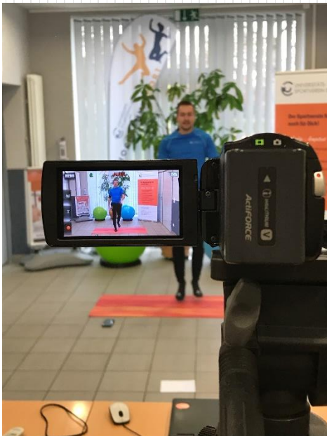
Foto- und Videoaufnahmen

Das Anfertigen und Veröffentlichen von Bild-, Film- und Videoaufnahmen während und im Zusammenhang des Kurses ist verboten.